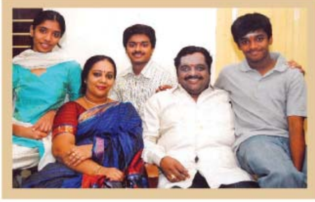
மனைவி,மகள் மற்றும் குடும்பத்தினருடன்

இசை உலக மூன்று தேவியர் எம்.எஸ்.அம்மா, எம்.எல்.வி அம்மா, டி.கே.பட்டம்மானு மூணு பேரோடவும் பேசிப் பழகுற வாய்ப்பு எனக்குக் கிடைச்சது. அதுவும் கே.பி.சுந்தராம்-பாள் அம்மாவுக்கு நானே சாப்பாடு கொண்டு போய்க் கொடுத்ததும் அவங்க என்னைப் பாடச் சொல்லிக் கேட்டு 'முருகா முருகா'னு ரசிச்சதும் பரவசமான அனுபவம். 'முருகானு பாடும்-போது, அடி வயித்துல இருந்து காத்தை இழுத்து மனசாரச் சொல்லு. தெய்வப் பாடல்கள் மக்களுக்-காக மட்டும் பாடுறதில்ல.. பகவானுக்-காகவும் பாடுறோம்.'னு அவங்க சொல்லி நான் கத்துக்கிட்-டிருக்கேன். கடைப்பிடிச்சுக்-கிட்டும் இருக்கேன்.